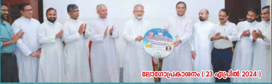
ലോഗോപ്രകാശനം ( 23 ഏപ്രിൽ 2024 )