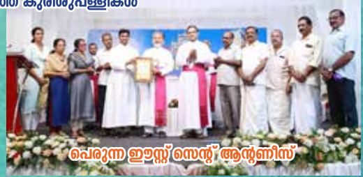
പെരുന്ന ഇറ്റസ് സെന്റ് ആന്റണീസ്