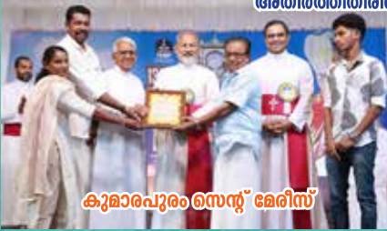
കുമാരപുരം സെന്റ് മേരീസ്