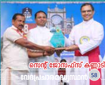
സെന്റ് ജോസഫ്സ് കണ്ണാടി