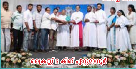
ക്രൈസ്റ്റ് കിങ് ഏറ്റുമാനൂർ