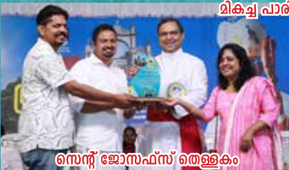
സെന്റ് ജോസഫ്സ് തെള്ളകു