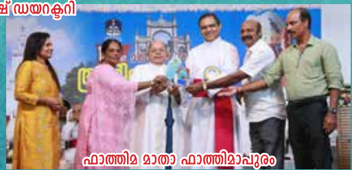
ഫാത്തിമ മാതാ ഫാത്തിമാപ്പുരം