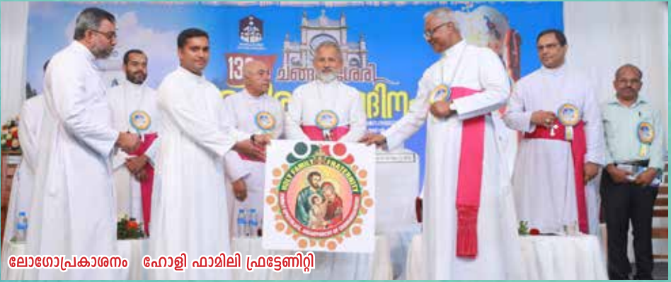
ലോഗോപ്രകാശനം ഹോളി ഫാമിലി ഫ്രട്ടേണിറ്റി