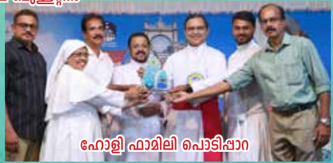
ഹോളി ഫാമിലി പൊടിപ്പാറ