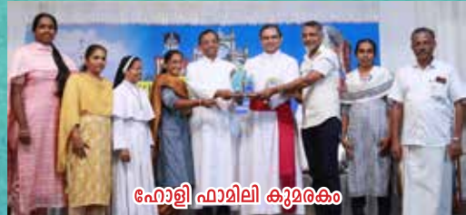
ഹോളി ഫാമിലി കുമരകം