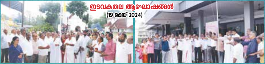
ഇടവകതല ആഘോഷങ്ങൾ (19 മെയ് 2024)