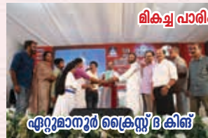
വിക്രമ പാരിഷ് ബുള്ളറ്റിൻ എറുമാനൂർ ക്രൈസ്റ്റ് കിങ്