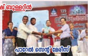
പാരൽ സെന്റ് മേരീസ്