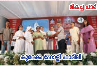
കുമരകം ഹോളി ഫാമിലി