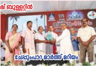
ചേപ്പുപാറ, മാർത്ത, മറിയം