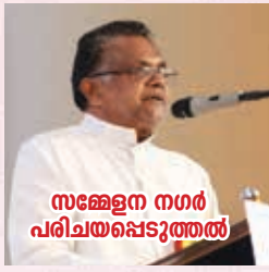
സഭയ്ക്കു നഗർ പരിചയപ്പെടുത്തൽ