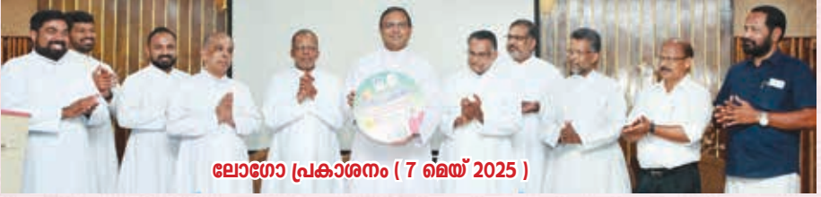
ലോഗോ പ്രകാശനം ( 7 മെയ് 2025 )

ചങ്ങനാശ്ശേരി സെന്റ് മേരീസ് മെത്രാപ്പോലീത്തൻപള്ളി കർദിനാൾ മാർ ആന്റണി പടിയറ നഗർ