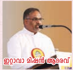
ഇറ്റാവാ മിഷൻ ആരംഭം