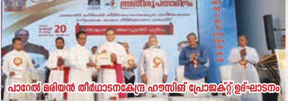
പാറേൽ മരിയൻ തീർത്ഥാടനകേന്ദ്ര ഹൗസിംഗ് പ്രോജക്ട് ഉദ്ഘാടനം