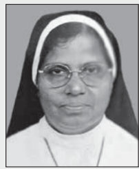
സി. തിരയോധേഷ്യ പടവിൽ SH

"താൻ നന്നായി പൊരുതി: എന്റെ ഓട്ടം പൂർത്തിയാക്കി: വിശ്വാസം കാത്തു." (2 തിമോ. 4:7)